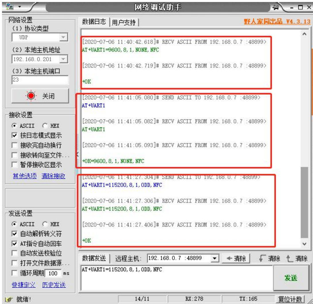
图 3 网络 AT 指令设置和查询

使用网络 AT 设置和查询基本一致，以下图设置串口参数为例，修改串口的波特率由 9600 到 115200 和校验位 NONE 到 ODD：