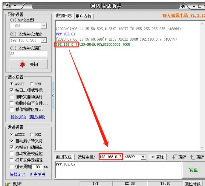
图 2 已进入网络 AT 模式