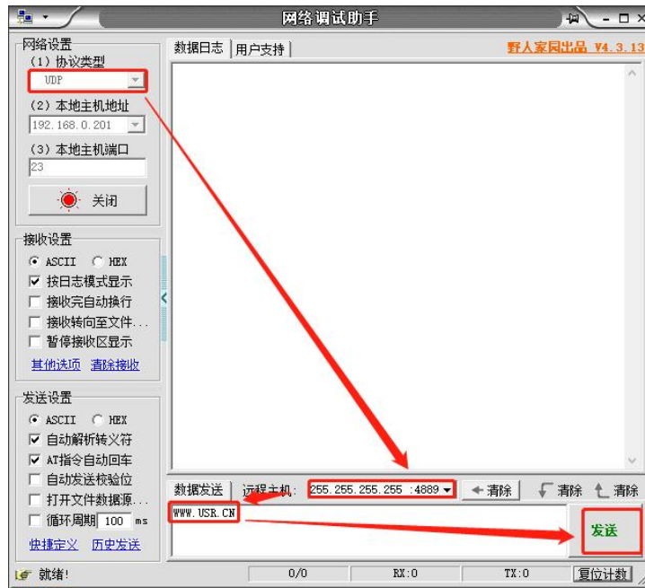
图 1 准备进入网络 AT 模式

通过网口 UDP 广播发送向端口 48899(远程主机设置为 255.255.255.255:48899)发送命令字，K7/K6/K5/K2 发送 WWW.USR.CN，K3 发送 0123456789。如果模块和电脑在同一网段内，则会收到模块回复的信息。