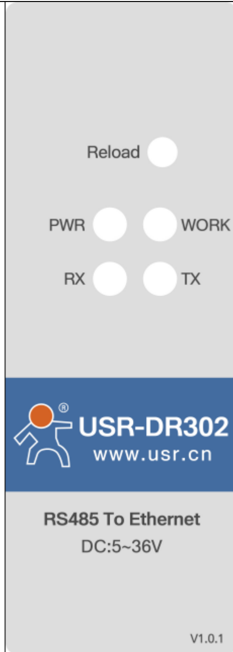
图 2 USR-DR302 串口服务器指示灯和 Reload 说明